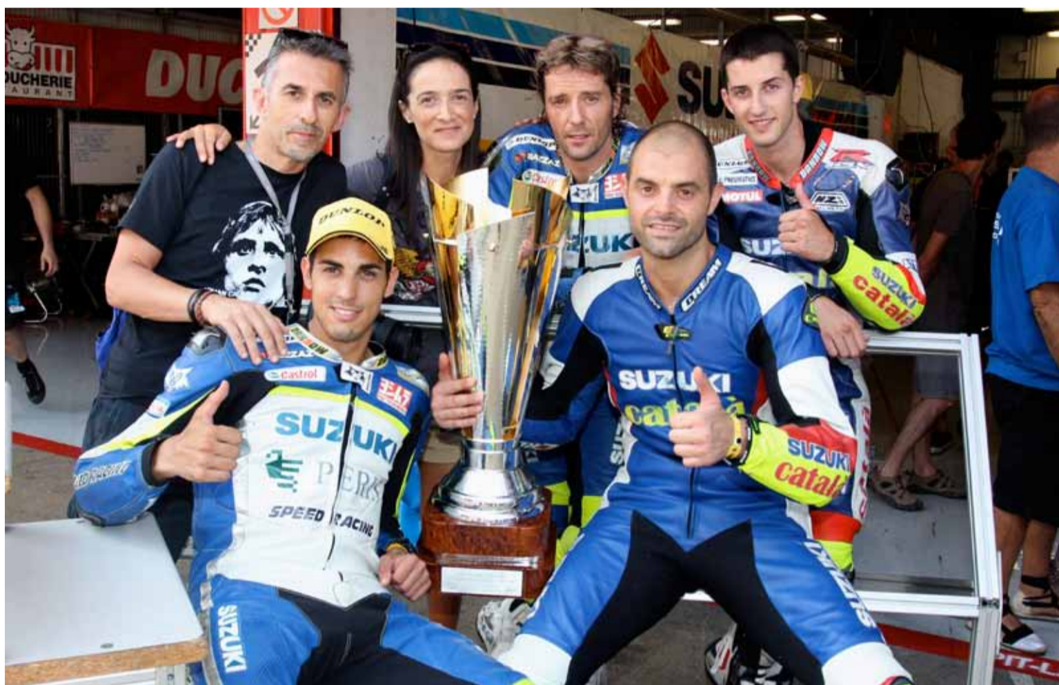
Tuvimos la suerte de compartir foto con el equipo ganador.