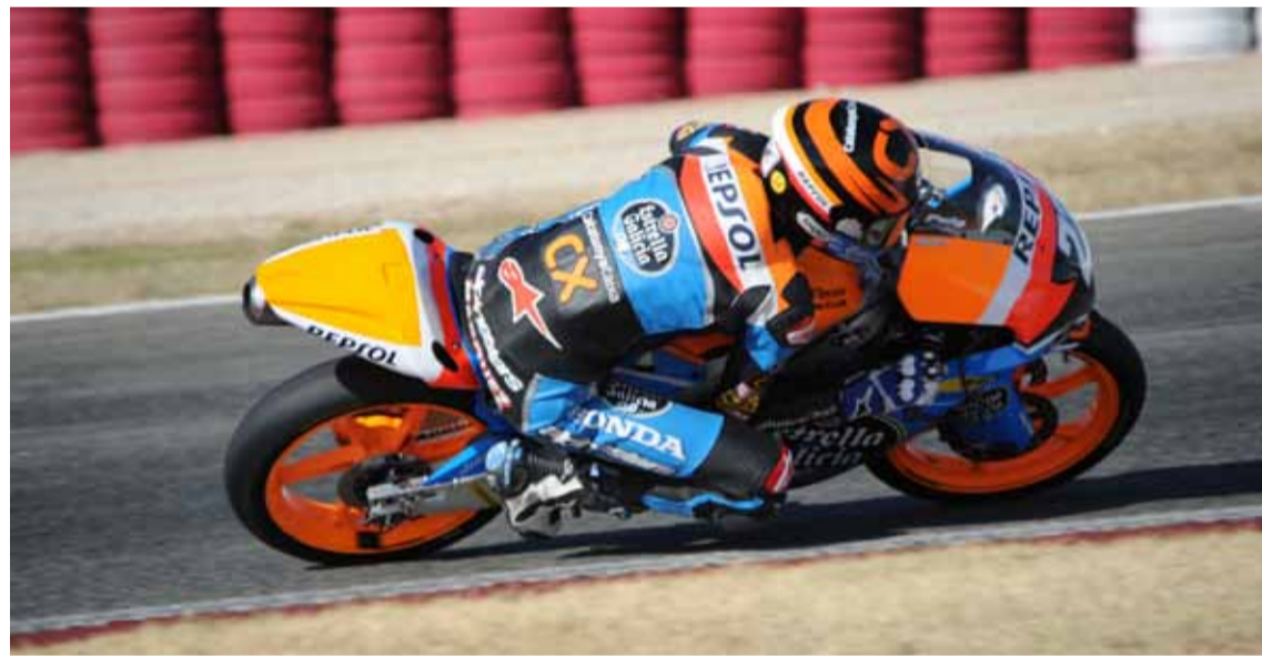
Alex Márquez logró la segunda victoria de la temporada y se consolida en el liderato.