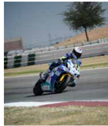
Del Amor fue derribado cuando marchaba en primera posición.

La siguiente cita del CEV será el 9 de septiembre en este mismo circuito de Albacete.