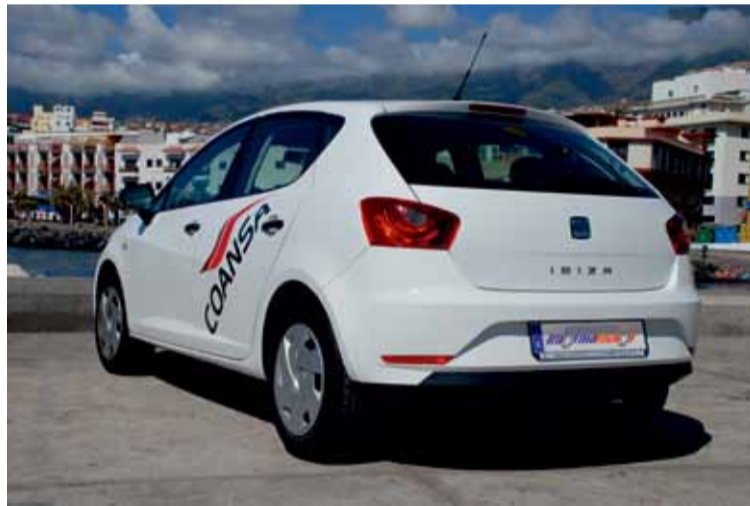
El logotipo de Seat hace las veces de apertura del portón del maletero.

De perfil, en el nuevo Ibiza destaca la característica Línea Dinámica que se aprecia desde los faros hasta la zaga, pasando por las expresivas