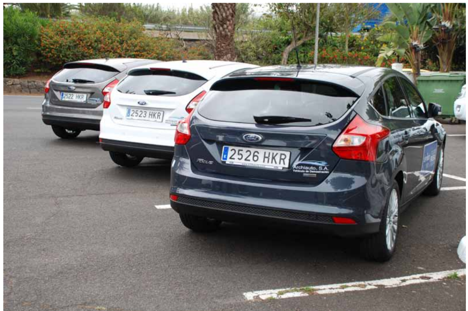
Archiauto puso en manos de los medios las unidades necesarias para realizar pruebas dinámicas. El EcoBoost sorprende por sus prestaciones y eficiencia.