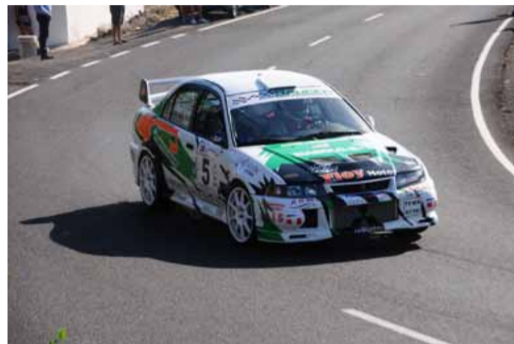
Rodríguez/Pais tercer equipo clasificado.