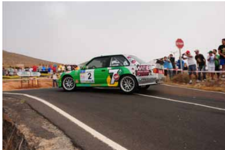
Ponce/Larrode, terceros, un equipo veterano siempre al mejor nivel.

Con las espadas en alto, después de terminar los tres tramos, Toñi ya con una diferencia mas que considerable, sacaba 35 segundos a Cabrales que seguía intentado cogerlo pero sin buenos resultados. Pero lograba sacarle mas de