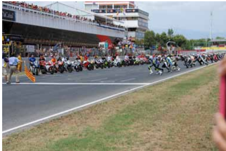
El momento más visto de las 24 horas.

Del Amor seguía a buen ritmo y en pocas vueltas dio caza a Checa al que supero en la entrada a meta. Y pronto la primera sorpresa. Checa cae en la curva 3 cuando del Amor ya le había superado y tiene que volver al box para reparar la moto. • Caen al puesto 41 de carrera a • 5 vueltas del Catalá que sigue en su línea.