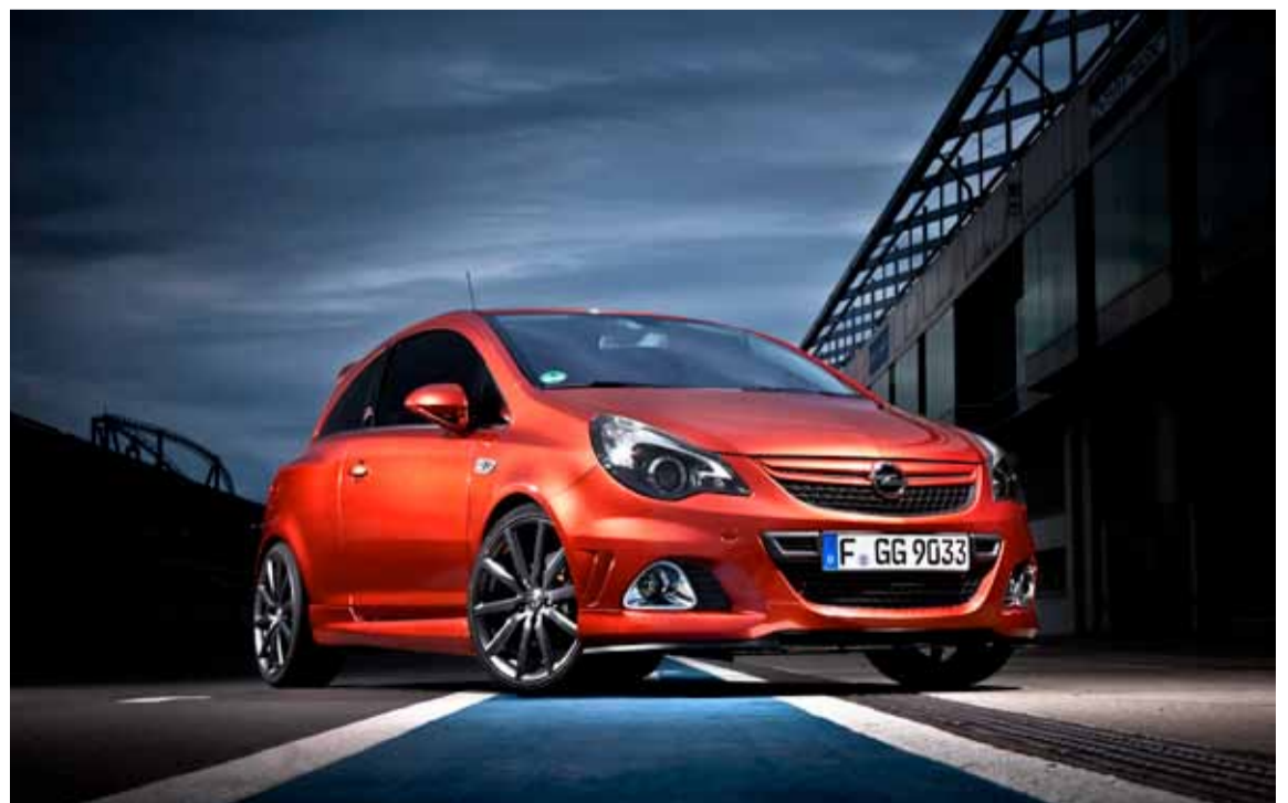
A lo largo de los años, los modelos OPC no se han colocado sólo como embajadores de altas prestaciones de la marca.