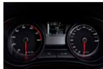
Cuadro completo con ordenador.

formas de los pasos de rueda. Una segunda línea, igualmente acentuada, recorre los hombros hasta los grupos ópticos en la parte trasera. La imagen de los pilotos posteriores, anchos en los extremos exteriores y puntiagudos en la parte central de la zaga, acentúan la proyección horizontal de la parte posterior.