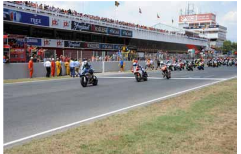
Salida: Sin comentarios