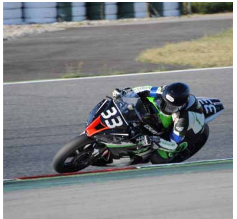
El equipo francés de Chevaux logró una meritoria 3ª plaza