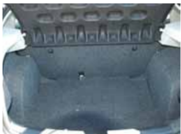
Un generoso maletero de 292 litros.

La versión de cinco puertas, con un diseño atractivo y deportivo, presenta un volumen de maletero de 292 litros. Con tanto espacio interior, el Ibiza está equipado al máximo para afrontar los retos de la vida cotidiana.