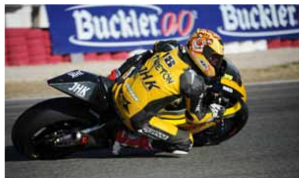
Torres se cayó en la última vuelta cuando lideraba la prueba.