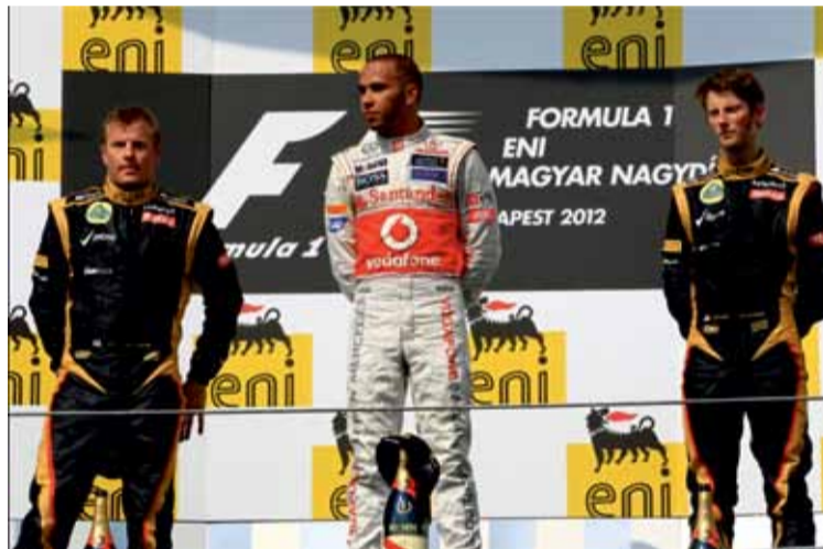
El podio de Hungría 2012. Hamilton, Räikkönen y Grosjean