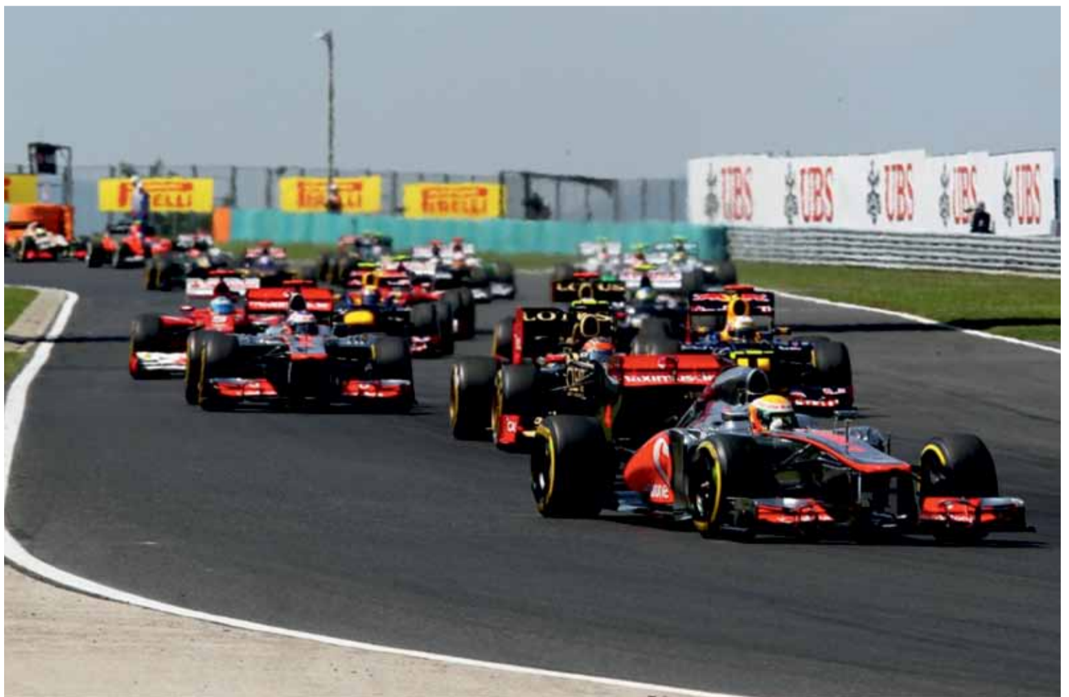
Louis Hamilton dominó desde los entrenamientos hasta el final de carrera.