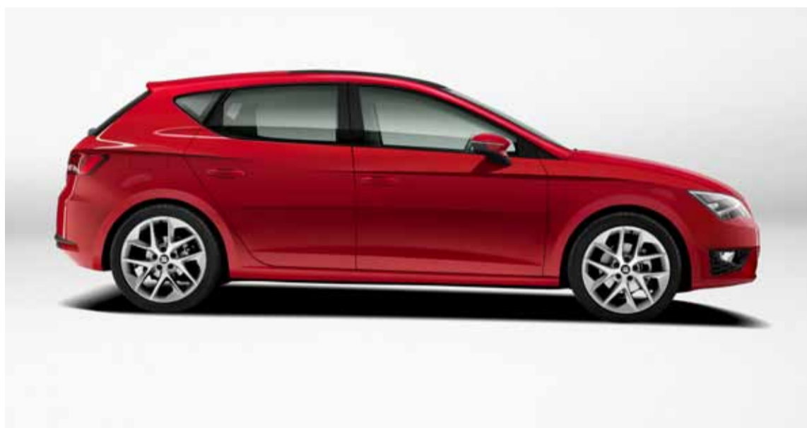
Presenta un nuevo diseño y ofrece un sinfín de elementos de tecnología punta.