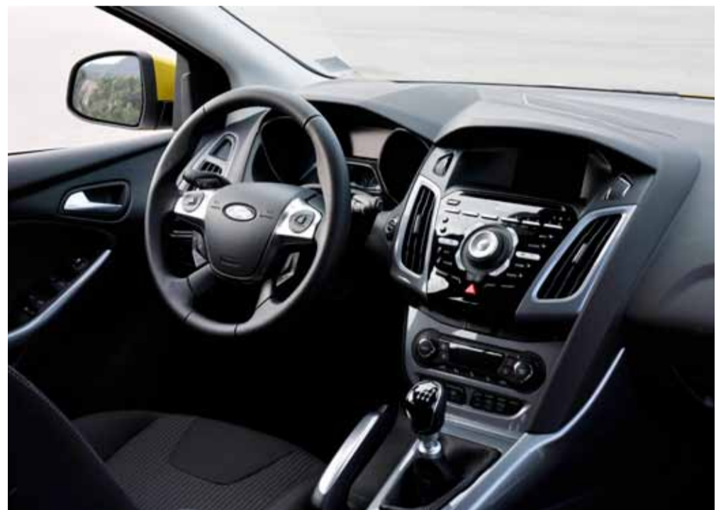
La caja de seis velocidades está pensada para ir en cambios largos sin renunciar a una conducción deportiva.