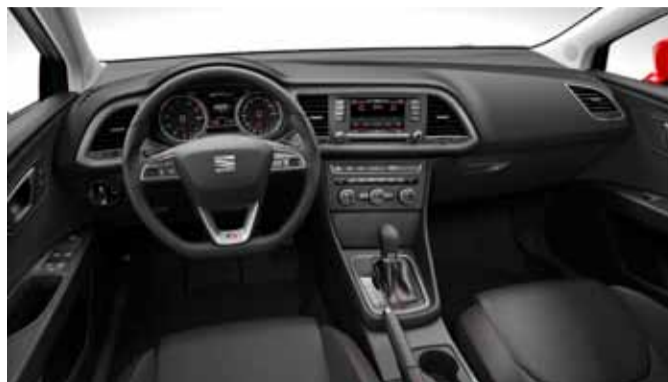
El Seat León es el primero en lucir el nuevo diseño del logotipo.