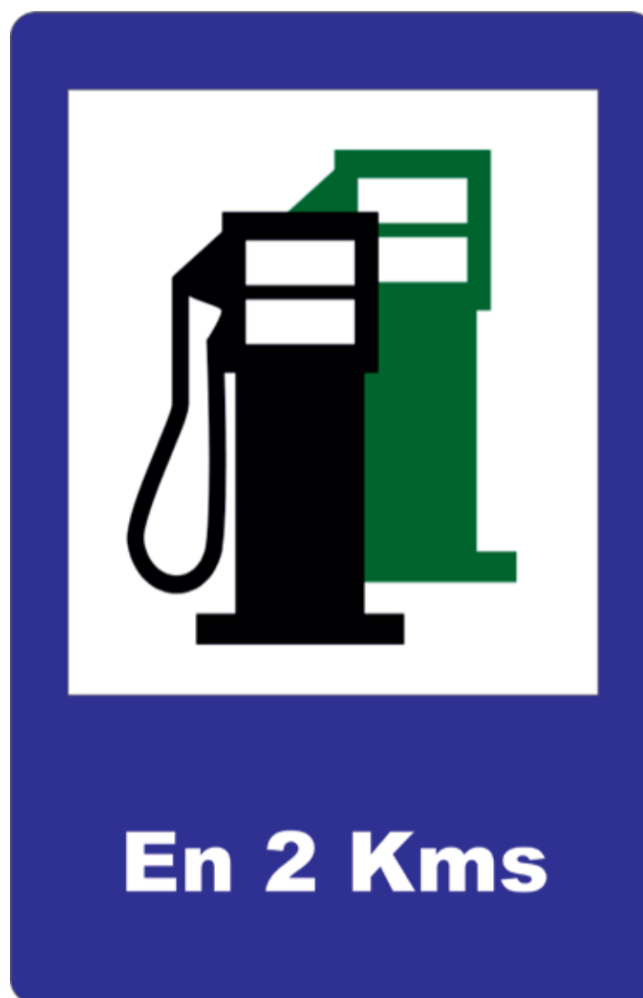
De momento la mayoría de los coches necesitan repostar si o sí.