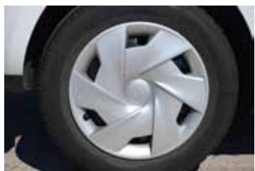
Muchos tipos de llantas donde elegir.