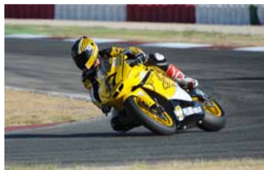
Una pronta caída de Rodri nos dejó sin espectáculo.