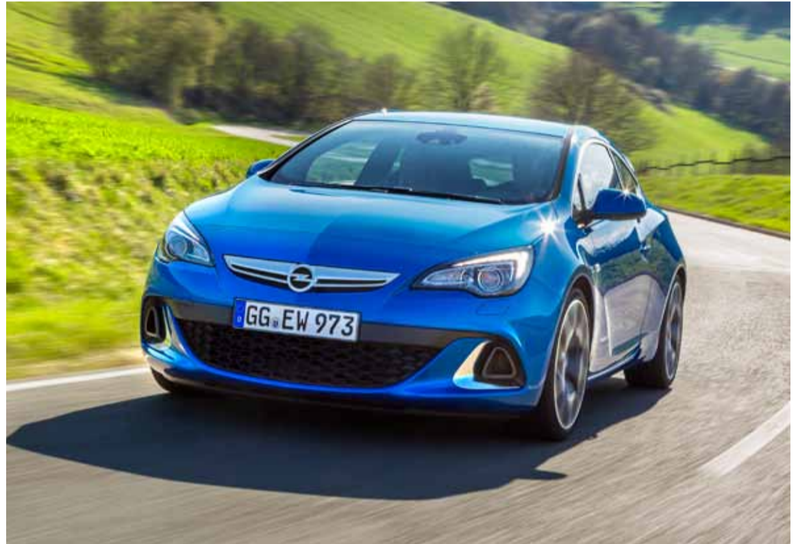
El motor de cuatro cilindros ofrece un 25% más par motor que el anterior Astra OPC y ofrece 40 CV más de potencia.

Con 210 CV y chasis de altas prestaciones