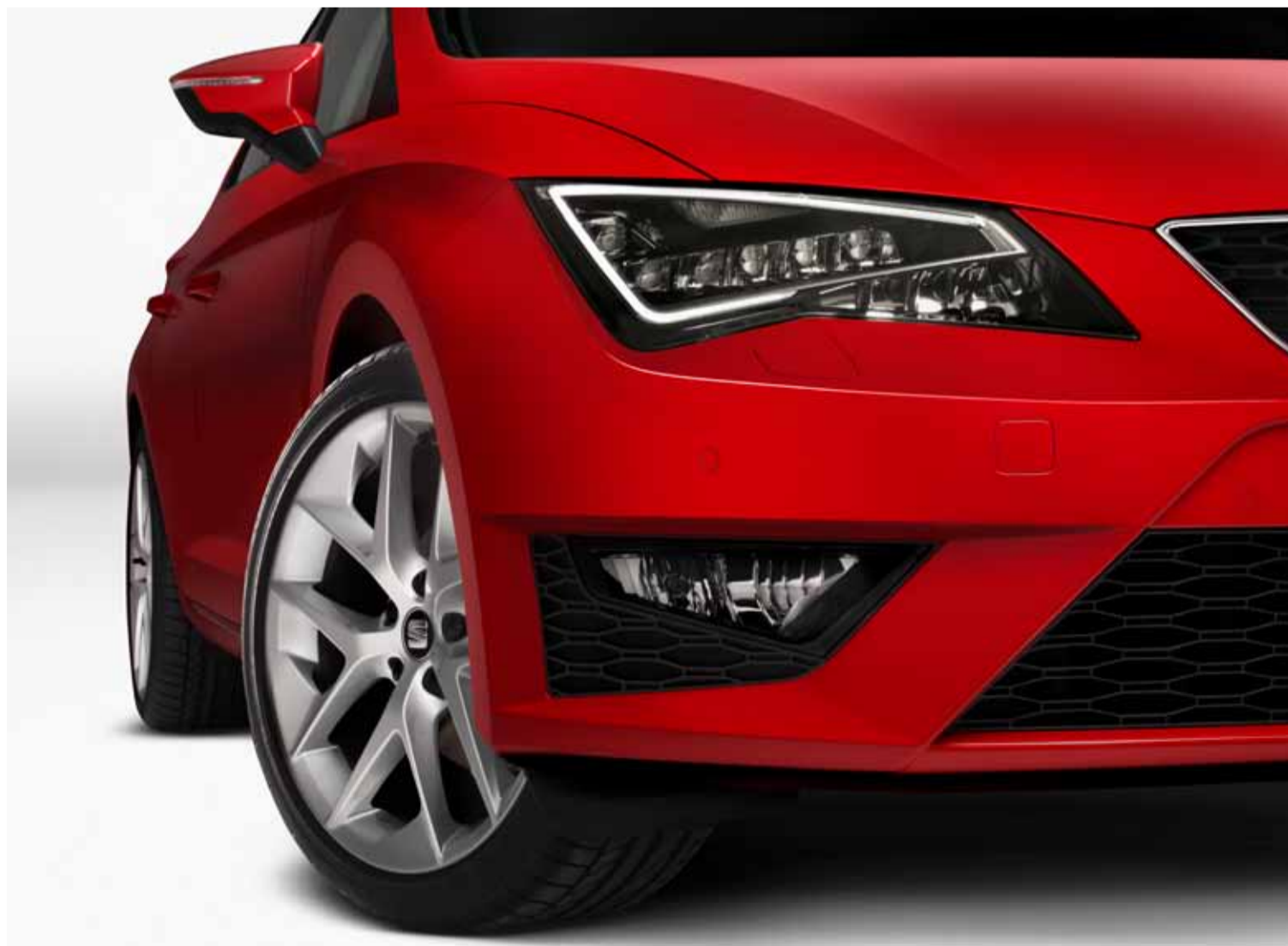
Otra novedad que presenta SEAT son los faros de LED integrales por primera vez en el segmento de los compactos.