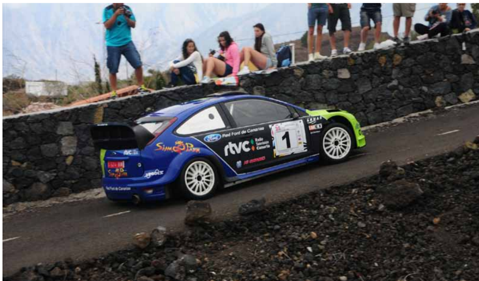
Capdevila/Rivero vencedores absolutos manejaron el ritmo de su coche sin contemplaciones.