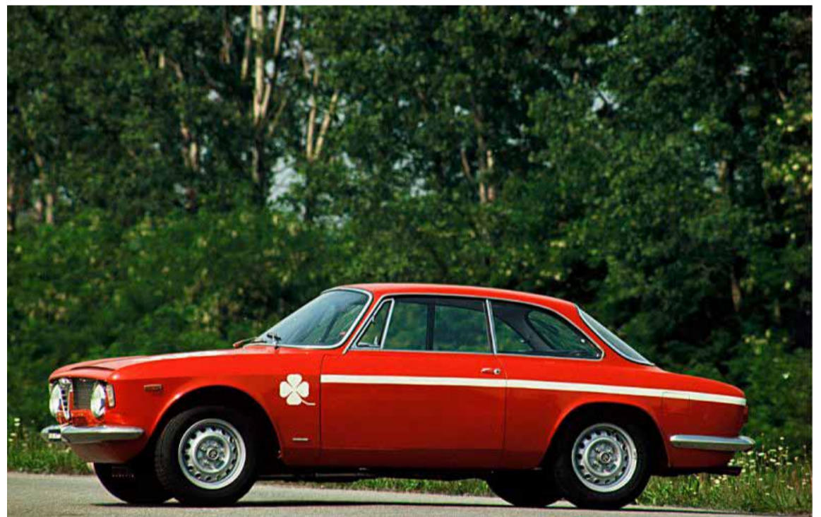
Giulia Coupé 1300 GTA Junior (1968-1975)