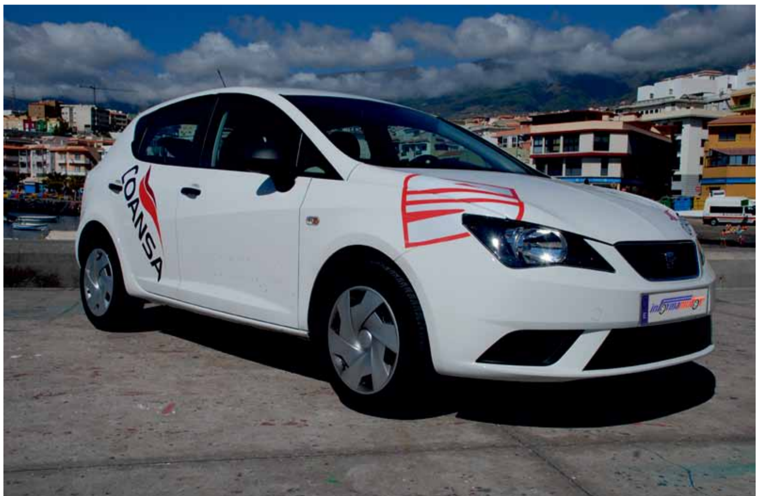
La gama de motores, muy eficientes, de nueva generación de tres y cuatro cilindros es amplia.