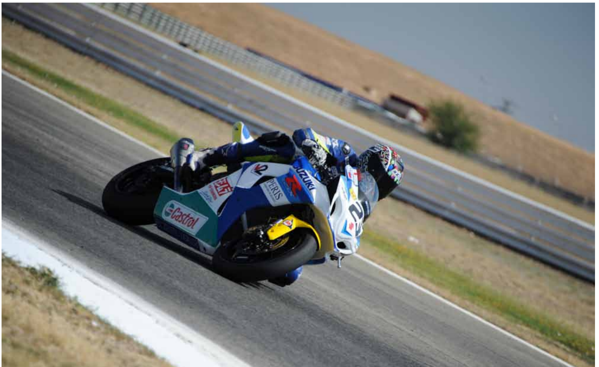
Suzuki Dunlop y Adrian Bonastre se estrenan en lo más alto del podio.