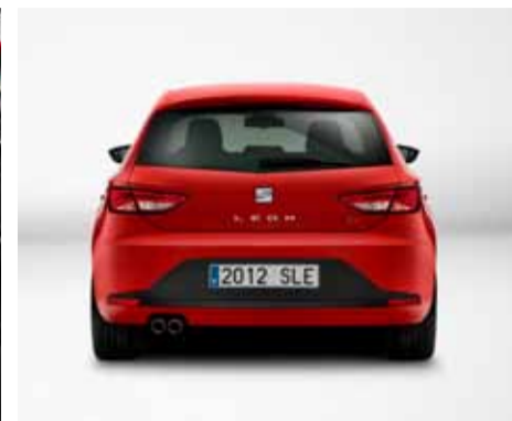
Sigue manteniendo su fuerte personalidad.