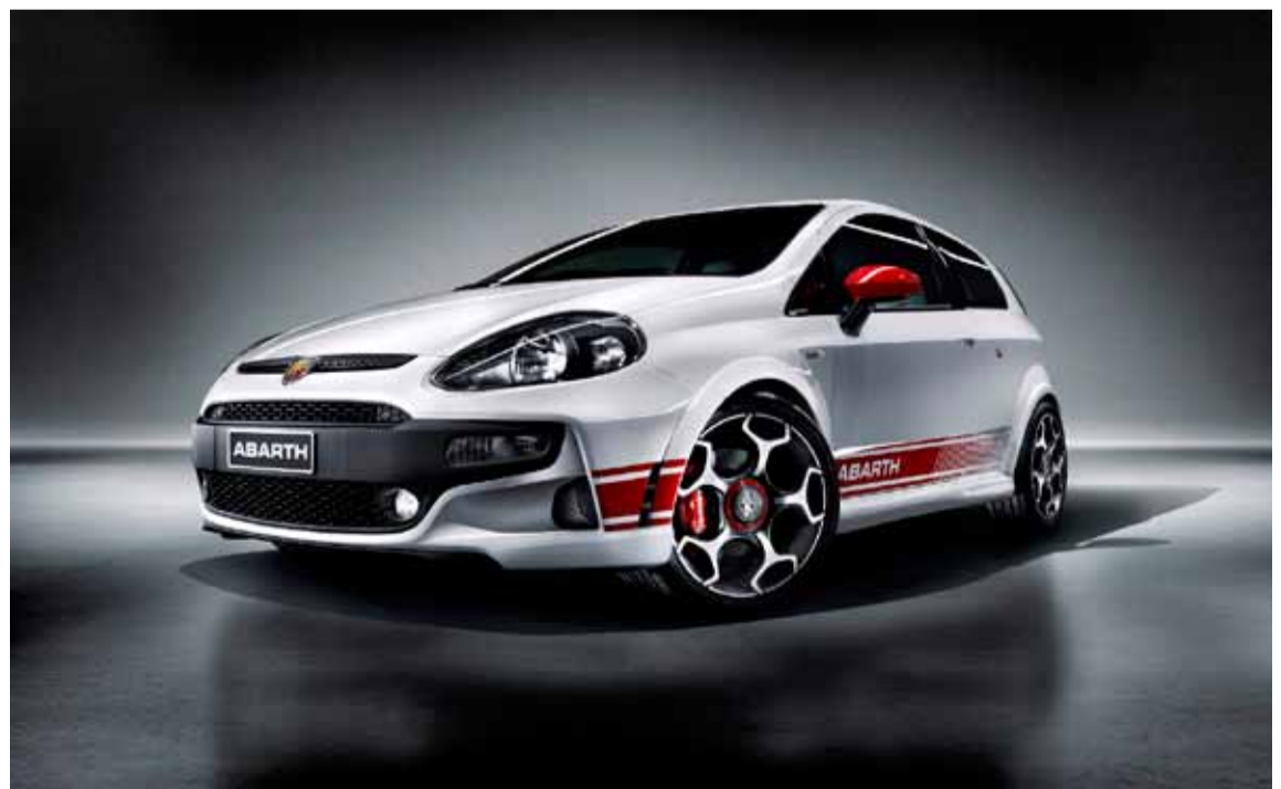
El Abarth Punto Serie 6 ofrece dos modalidades de uso (superdeportivo "Sport" y urbano "Normal")