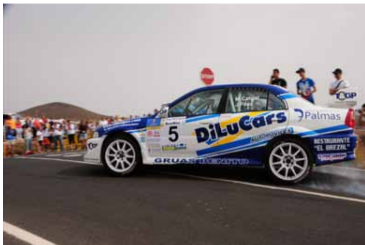
Cabrales/Paez, segundos, corrieron de lo lindo pero no inquietaron al líder.