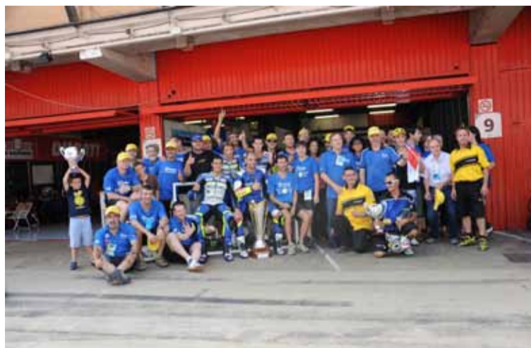
Equipo Suzuki, Dunlop Català al completo despues de proclamarse vencedores.